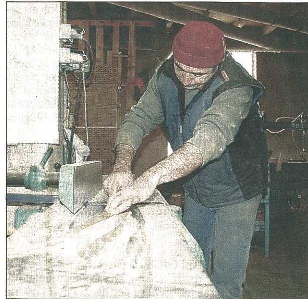
Les pièces sont réalisées au millimètre près...

La semaine prochaine : 24 heures avec le maire d'une petite commune