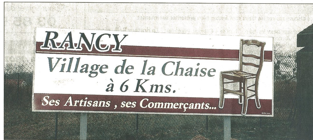
Pour préserver les trois emplois et l'activité, Bois Form' a décidé de reprendre la société Badaud-Duquet

Un groupe de travail a ainsi été mis en place avec le concours de la CCI, de la Drire, sans oublier bien évidemment les chaisiers. Une réunion va se tenir demain, où une association de promotion et de développement devrait voir le jour. Le but de ce groupe de travail, même si pour l'instant ce n'est qu'un projet et que rien n'est fait, est de réfléchir à des pistes pour faire évoluer la profession de chaisier et la préserver, tout en défendant le savoir-faire de ce