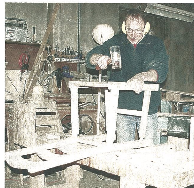
...avant d'être assemblées les unes aux autres